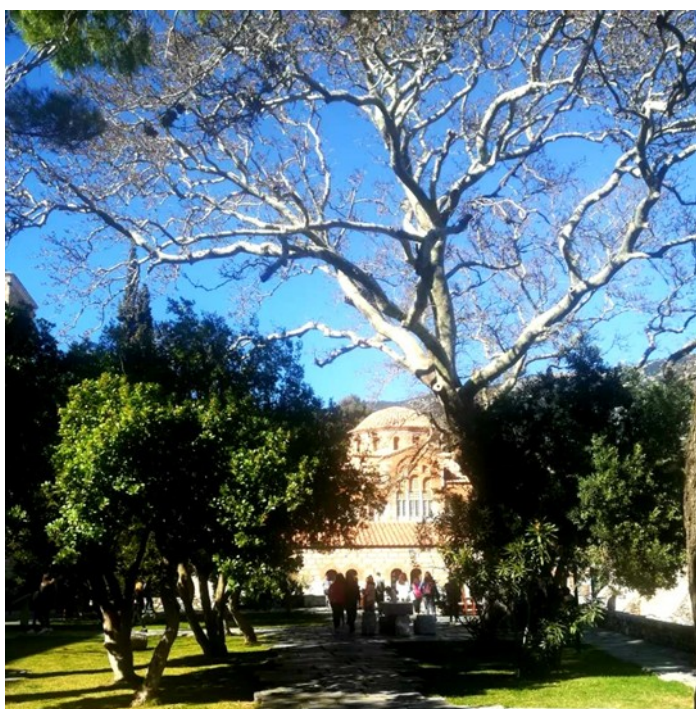
Ιερά Μονή Οσίου Λουκά – Μνημείο Παγκόσμιας Κληρονομιάς της UNESCO