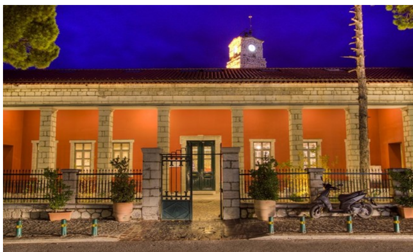
Το Λαογραφικό Μουσείο Αράχωβας

Συντονίζει ο Γρ. Τσάλτας, Ομ. Καθηγητής, Διευθυντής ΕΚεΠΕΚ