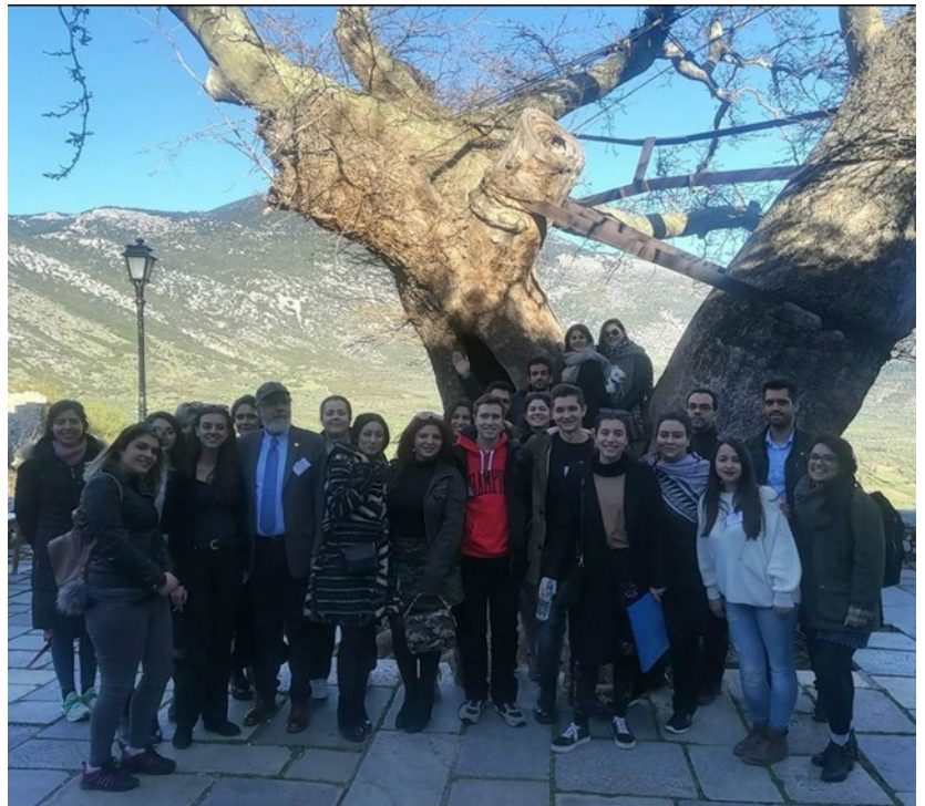
Οι συμμετέχοντες του Χειμερινού Σχολείου στην Ιερά Μονή Οσίου Λουκά