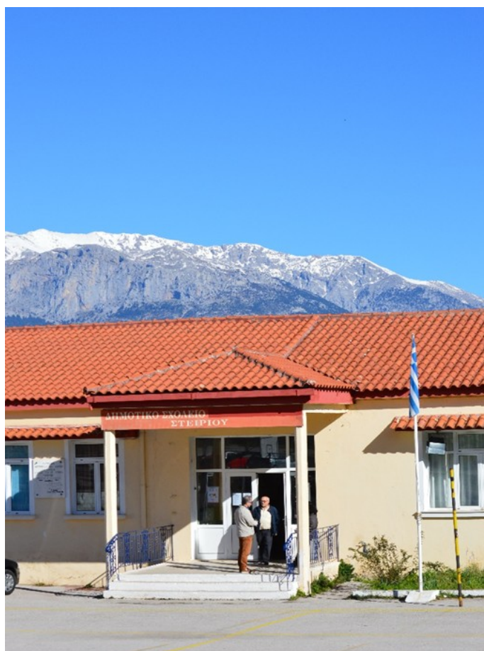
Το Δημοτικό Σχολείο Στειρίου